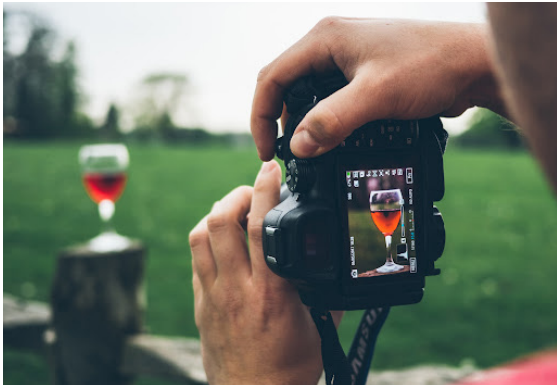
Gambar 5. Perekaman realitas oleh fotografer yang melibatkan unsur subyektifitas ( http://jasafotojakarta.com/trik-fotografer-untuk-jepretan-yang-maksimal )

Seperti terlihat dari contoh gambar 5 di atas. Peran fotografer mempengaruhi realitas imaji fotografi yang dihasilkan yang tampak dalam bingkai. Dari gambar di atas terlihat luasnya realitas yang ada di depan fotografer, namun atas kuasanya dapat menentukan seberapa luas realitas yang akan dihadirkan dalam bingkai dan kemudian ditampilkan dalam imaji. Cawan dengan isi air merah dapat dihadirkan dalam bingkai dengan berbagai luas tampilan. Bisa hadir bersama dengan keseluruhan tonggak kayu yang dipergunakan sebagai tempat meletakkan cawan, bisa pula mengganti format vertikal menjadi horizontal sehingga rumput sebagai latar belakang akan lebih banyak hadir. Namun di sini fotografer memutuskan untuk menghadirkan keseluruhan cawan saja, sehingga cawan berisi air merah tersebut terlihat dominan hadir dalam bingkai. Hasil dari pemilihan realitas yang ditampilkan dalam imaji adalah unsur subyektivitas yang mewakili keinginan dari fotografer.