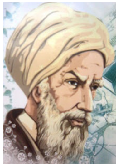
Gambar 1. Abu All Muhammad al-Hassan ibnu al Haitham ( https://www.biografiku.com/biografi-ibnu-al-haitham .)

Dalam teorinya dijelaskan bahwa bukan mata yang memberikan cahaya, tetapi benda yang memantulkan cahaya menuju mata yang kemudian menghasilkan penglihatan. Di samping itu Al Hazen juga menemukan bahwa semakin kecil lubangnya, semakin terfokus cahaya dan semakin tajam gambar yang dihasilkan dan membuktikan bahwa cahaya merambat melalui garis lurus. Penemuan ini mengarah ke penemuan kamera lubang jarum, awal mula kamera modern (Jailani).