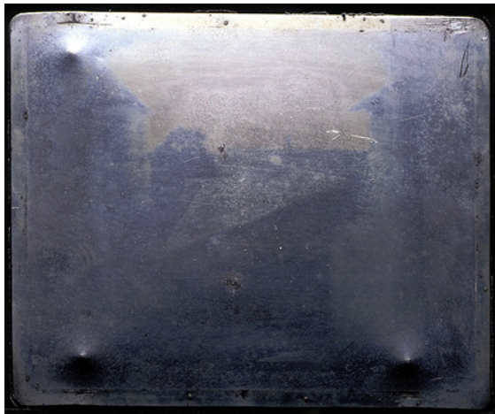
Gambar 2. Joseph Nicéphore Niépce - View From The Window At Le Gras ( http://sharpen-ny.org/the-achilles-heel-of-modern-photography )

Walaupun dari segi kepraktisan belum dianggap berhasil namun apa yang sudah ditemukan Niepce merupakan dasar utama fotografi yang akan menjadi pijakan dasar pada penelitian dan pengembangan fotografi ke depan.