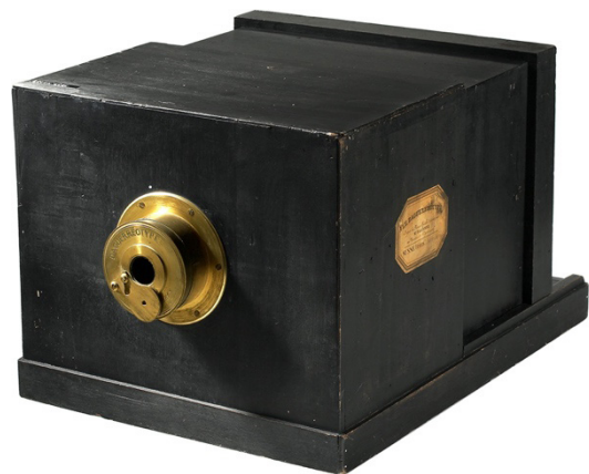
Gambar 3. Kamera Daguerreotype 1839

Usaha Daguerre untuk terus melanjutkan hingga pada 19 Agustus 1839, berhasil membuat imaji positif permanen pada plat tembaga perak yang dilapisi iodin yang dicuci larutan garam dapur. Plat tersebut disinari cahaya langsung dengan pemanas merkuri (neon) selama satu setengah jam. Proses ini olehnya disebut daguerreotype . Penemuan ini jauh lebih praktis dan waktu yang dibutuhkan untuk penyinaran lebih singkat. Sayangnya imaji yang dihasilkan adalah positif yang tidak memungkinkan untuk digandakan. Hal ini bertentangan dengan prinsip kemassalan dari revolusi industri.